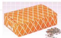
ライト強力安全ピン